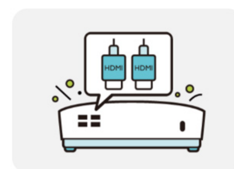
Doble Entrada HDMI