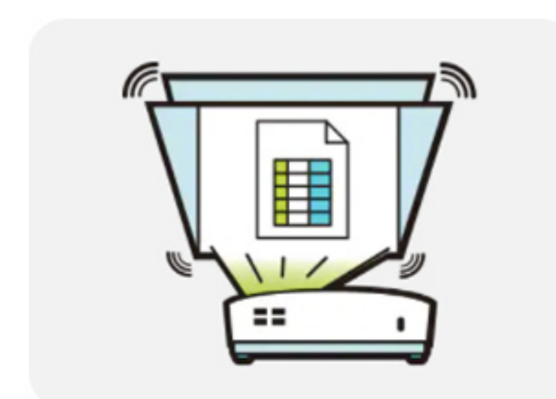
Auto Corrección Trapezoidal